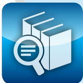
VOLLTEXT- SUCHE (OCR)